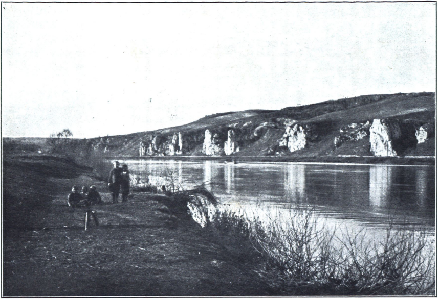
Jurafelsen gegenüber von Sinzing, darüber Kreideformation.